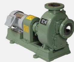
Bơm bùn, bơm nước thải Mitsuba Nhật