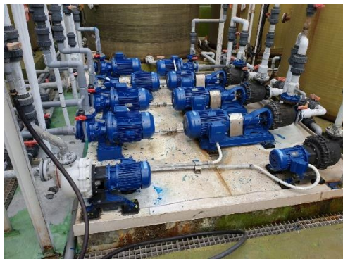
Cung cấp bơm nhà máy Meiko