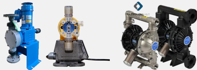
Bơm định lượng Tacmina Nhật