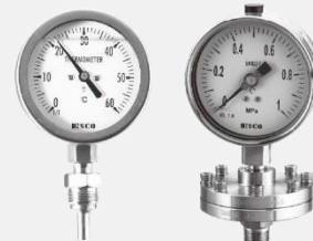
Đồng hồ đo nhiệt, đo áp suất Hisco- Hàn