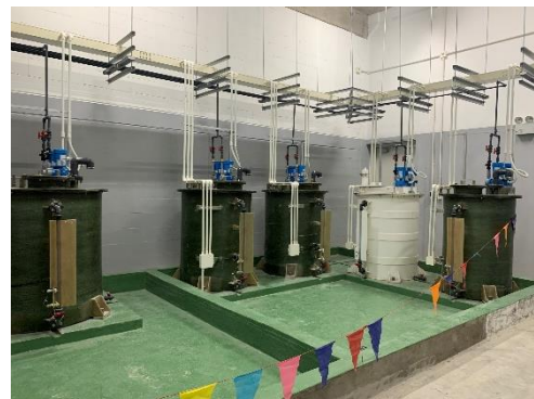
Cung cấp bơm nhà máy SEOV