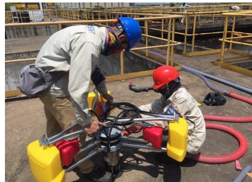
Cung cấp bơm nhà máy Formosa