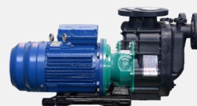
Bơm hóa chất – bơm trực đứng- bộ xử lý dầu tràn bề mặt – World Chemical